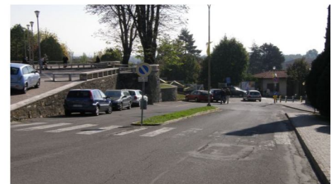
Esempio 3: Viale Pacem in Terris Manca il passaggio a raso sulle strisce pedonali che danno accesso al sagrato