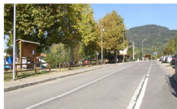
Esempio 2: Via Rebuzzini Mancano le strisce pedonali per l'accesso al parco giochi e all'area di sosta

In questa ricognizione mi sono limitato a verificare le sole aree pubbliche, destinate a parcheggio, marciapiedi e strisce pedonali. Quello che ho colto è la frequente interruzione dei marciapiedi e l'assenza dei passaggi "a raso" - tanto preziosi per le carrozzine - in prossimità degli attraversamenti pedonali. Ho circoscritto la mia passeggiata nelle vie del centro storico del capoluogo, le più soggette al traffico veicolare e pedonale. Non ho verificato le zone periferiche del paese e le frazioni. Come del resto, non mi sono recato all'interno degli edifici pubblici (scuole, municipio, sale civiche e ambulatori, il centro sportivo, i cimiteri) e negli spazi privati ad uso pubblico (negozi, bar e ristoranti, banche, luoghi di culto): qui le barriere architettoniche devono essere assenti per gli indirizzi normativi vigenti!