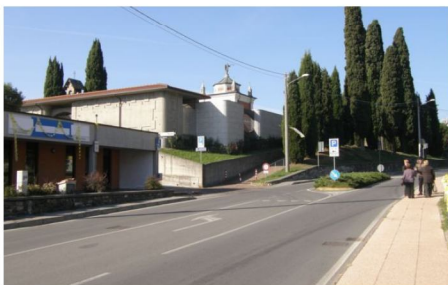
Esempio 1: Via IV Novembre Mancano le strisce pedonali davanti a bagni pubblici e sportello IAT

Ho cercato infatti di "muovermi" con le gambe di un anziano, il passeggiare - con bimbo - guidato da una mamma o le ruote di una carrozzina, l'unico mezzo che permette alla persona disabile di spostarsi sul territorio. Il mio obiettivo è stato quello di verificare gli ostacoli che limitano una piena "accessibilità urbana", impedendo il facile movimento alle persone svantaggiate; in altre parole individuare la presenza di BARRIERE ARCHITETTONICHE.