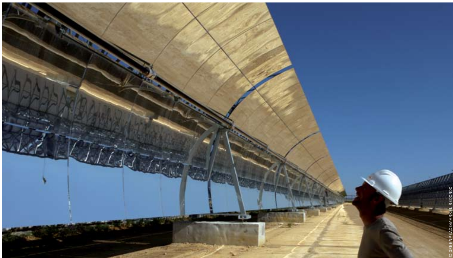
image WORKERS EXAMINE PARABOLIC TROUGH COLLECTORS IN THE PS10 CONCENTRATING SOLAR TOWER PLANT IN SEVILLA, SPAIN. EACH PARABOLIC TROUGH HAS A LENGTH OF 150 METERS AND CONCENTRATES SOLAR RADIATION INTO A HEAT-ABSORBING PIPE INSIDE WHICH A HEAT-BEARING FLUID FLOWS. THE HEATED FLUID IS THEN USED TO HEAT STEAM IN A STANDARD TURBINE GENERATOR.

“NOW IS THE TIME TO COMMIT TO A TRULY SECURE AND SUSTAINABLE ENERGY FUTURE – A FUTURE BUILT ON CLEAN TECHNOLOGIES, ECONOMIC DEVELOPMENT AND THE CREATION OF MILLIONS OF NEW JOBS.”