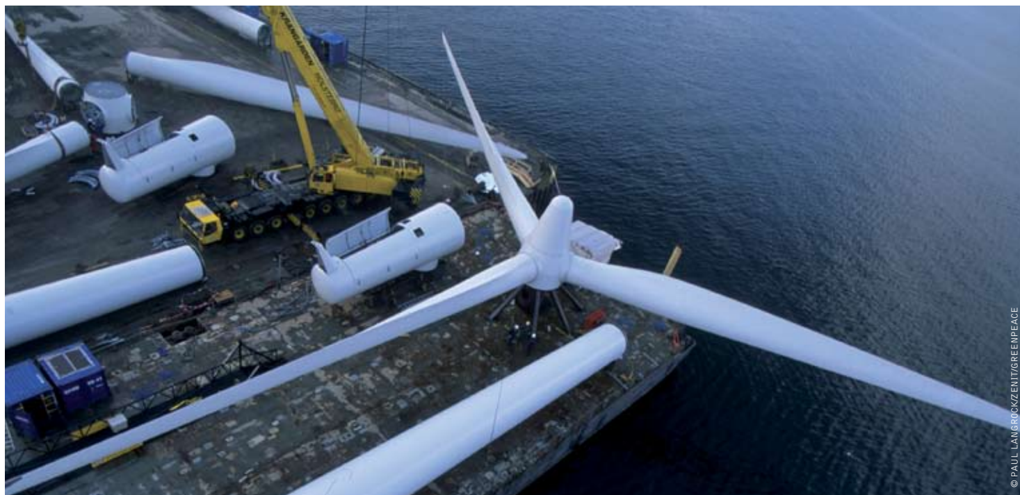
image CONSTRUCTION OF THE OFFSHORE WINDFARM AT MIDDELGRUNDEN NEAR COPENHAGEN, DENMARK.

"TOWARDS A SUSTAINABLE ENERGY SUPPLY SYSTEM - NEVER BEFORE HAS HUMANITY BEEN FORCED TO GRAPPLE WITH SUCH AN IMMENSE ENVIRONMENTAL CRISIS."