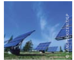
image SOLON AG PHOTOVOLTAICS FACILITY IN ARNSTEIN OPERATING 1,500 HORIZONTAL AND VERTICAL SOLAR "MOVERS". LARGEST TRACKING SOLAR FACILITY IN THE WORLD. EACH "MOVER" CAN BE BOUGHT AS A PRIVATE INVESTMENT FROM THE S.A.G. SOLARSTROM AG, BAYERN, GERMANY.